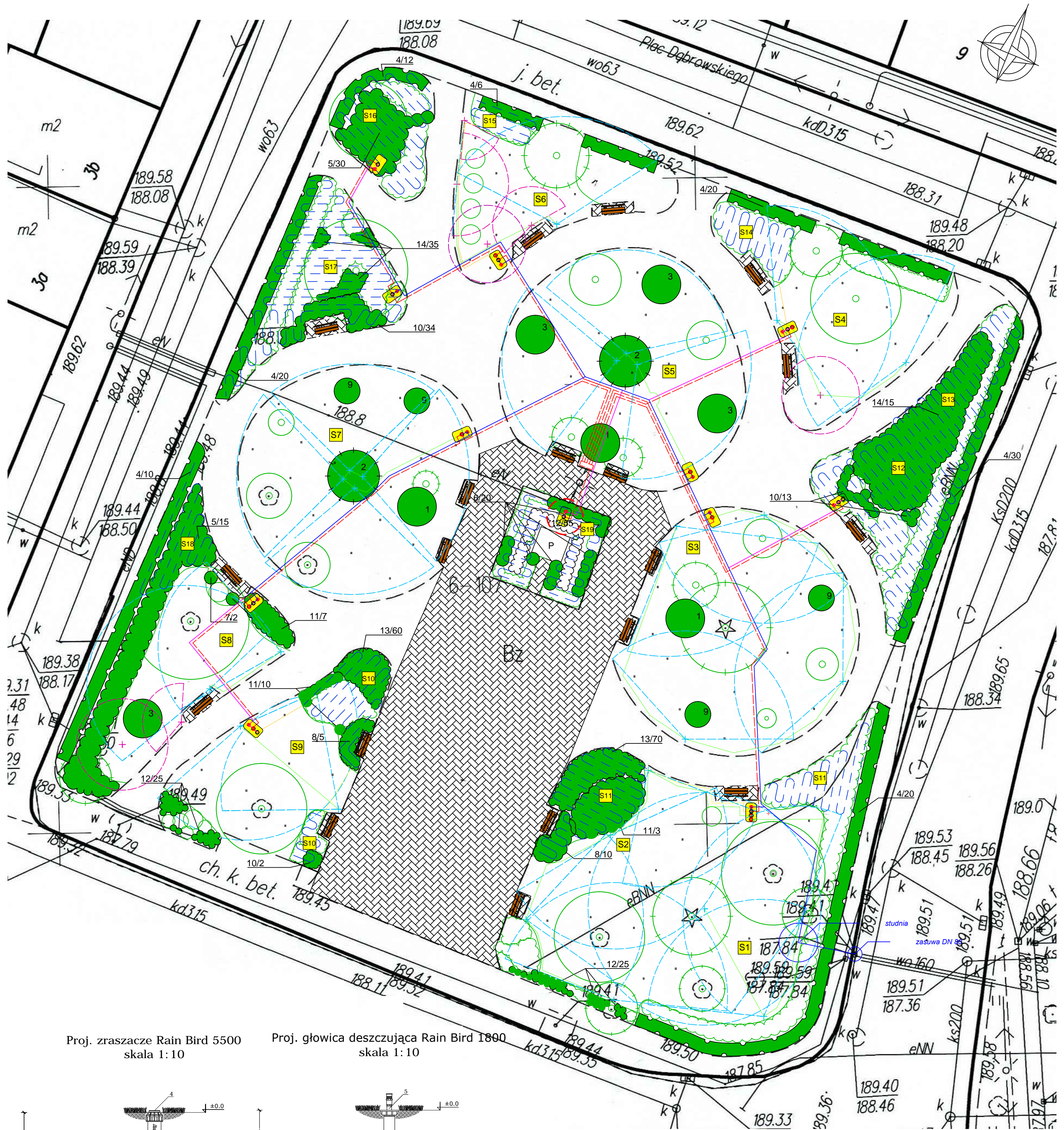
Proj. zraszacz Rain Bird 5500 skala 1:10